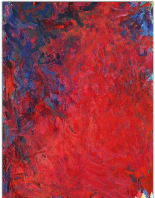
"Con ali diverse" 2009 olio su tela, cm.130x100