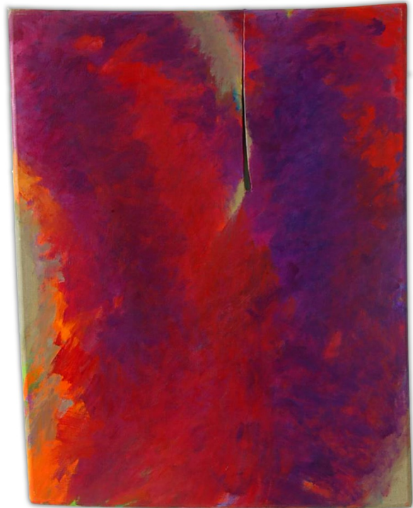
"Elegia di porpora" 2005 olio su tela, cm.140x110

Alessandro Fieschi dal catalogo della mostra "Lirica-mente"