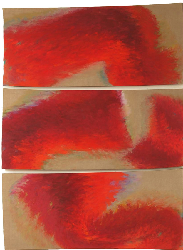
"Dilemma" 1999 olio su tela

Tetsuro Shimizu, nasce a Tokyo nel 1958. Dal 1987 vive e lavora a Milano.