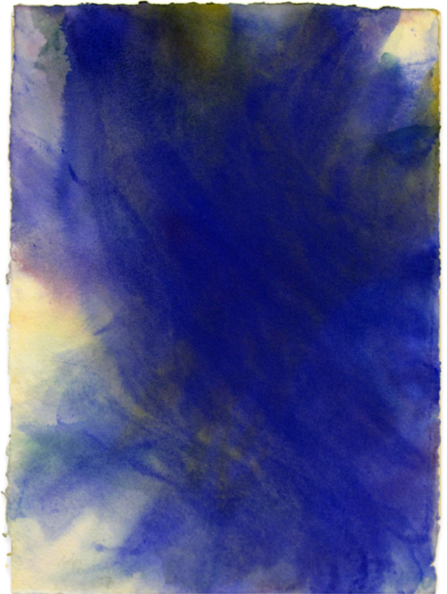
"Senza titolo" 2009 acquarello su carta, cm.80x57

Valerio Dehò dal catalogo della mostra "Geometria interiore"